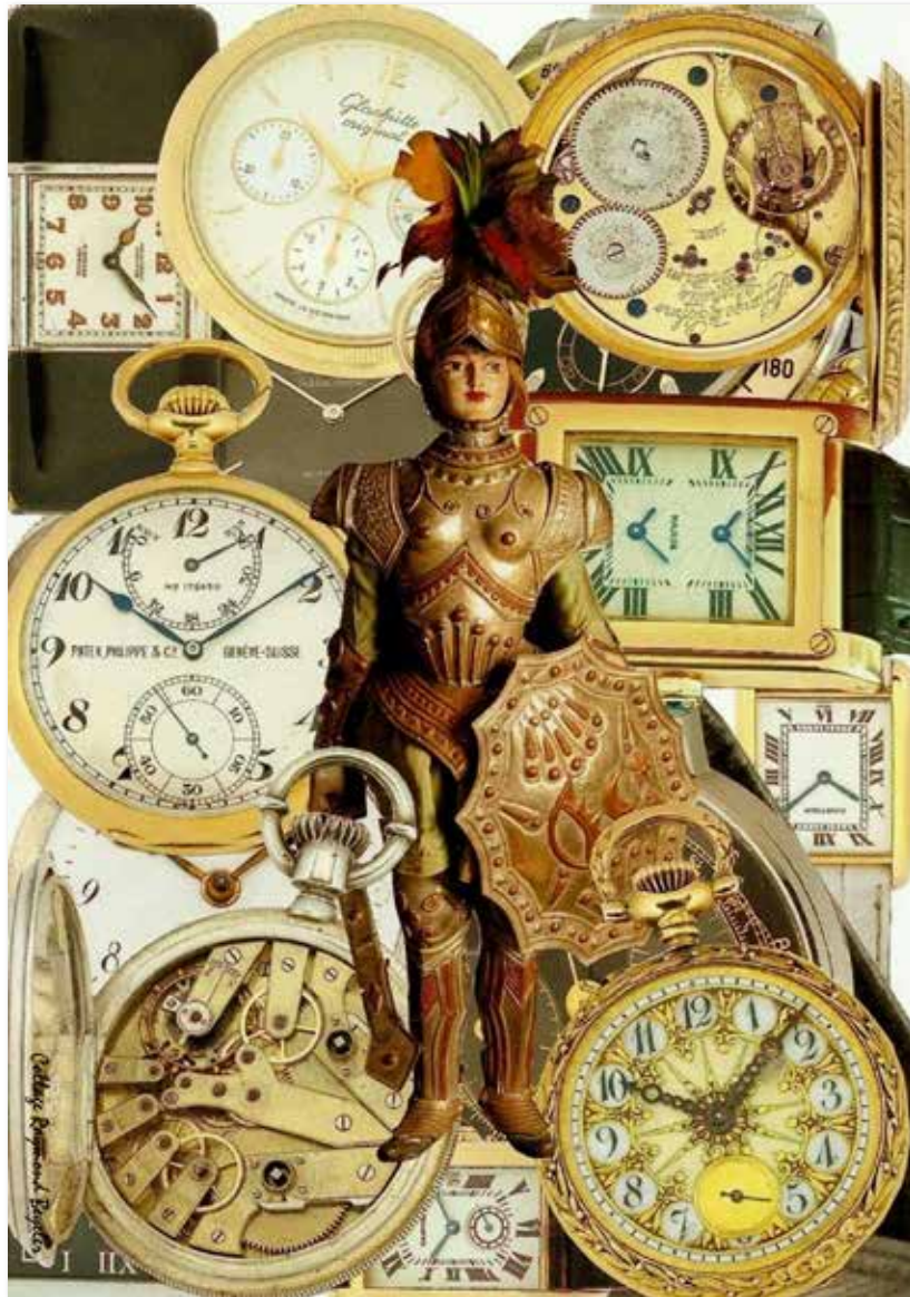
Le Temps - Collage Raymond Beyeler