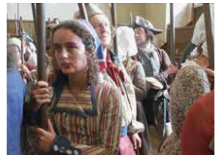
Le Peuple à la Législative