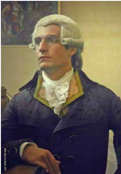
Robespierre - Louis Garrel

tionnaire et représenter le Peuple. C'est méritoire. Et approprié, quand on adhère au idéaux. Mais il fallait ignorer la complexité de l'entreprise, le sang inexpiable des prisons, la fragilité du pouvoir devant l'insurrection, le péril aux frontières. Et l'accusateur public. Difficile de réduire l'exaltation dans les jours sans pain, quand l'Ancien régime et L'Ami du peuple ont porté le fer à l'incandescence : quiconque n'a jamais craint pour sa vie serait en peine de porter un jugement.