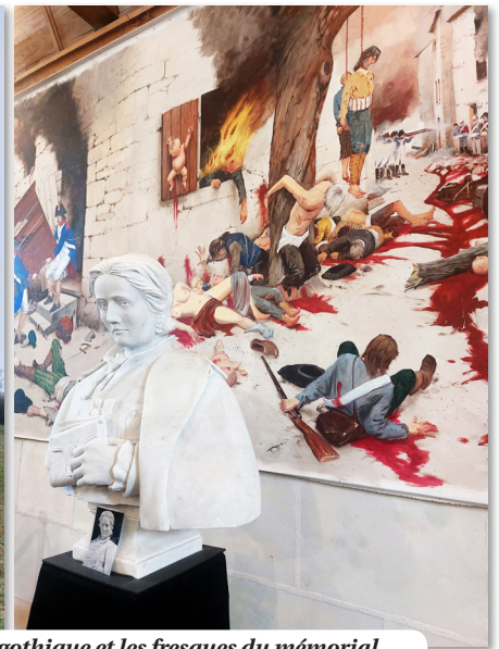
En médaillon, la duchesse d'Angoulême, La chapelle à l'architecture néo-gothique et les fresques du mémorial destinées à commémorer toutes les exterminations des guerres de Vendée.