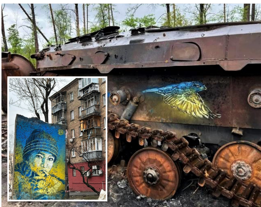
Ukraine // Photo mars-mai 2022 © Christian Guémy

Le sang attire toujours les journalistes, mais c'est leur « pain quotidien », les écrivains mais également les artistes. Aujourd'hui je vais vous parler du travail de l'artiste de rue Christian Guémy, alias C 215. Ce que nous appelons le « street art » et qui se découvre sur les murs de nos villes et parfois de nos campagnes, entrepôts, et usines.