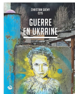
Guerre en Ukraine de Christian Guémy - C 215 - Critères-éditions Grenoble 2023 - 20 Euros -

même si la vie des artistes sur le terrain peut se trouver mise en danger car les pochoirs n'ont jamais protégé des balles ou des missiles. Pourtant, en mars 2022, au début du conflit, l'artiste a pris ses pochoirs et ses bombes de peinture et s'est rendu par deux fois en Ukraine. Il y a montré qu'un artiste engagé pouvait changer la physionomie des rues et apporter un peu de sérénité. Ici une tête d'enfant, là un papillon aux couleurs de l'Ukraine, des fleurs ou encore des visages de femmes ou de personnes âgées. Il était difficile de bâtir une exposition de telles œuvres qui parsèment Kyïev, Lviv, Jytomyr, Hostomel ou Bucha car elles montrent un mur entier détruit en grande partie, un char russe définitivement stoppé, des murs d'un appartement totalement ouvert sur l'avenue. Ce livre est donc la somme des photos prises, de ces œuvres éphémères et intransportables mais terriblement parlantes à notre cœur. Et le Testament, poème écrit en 1948 par le grand Taras Chevtchenko, dont le portrait a été réalisé au pochoir, ne peut que résonner longuement dans nos têtes C'est un hommage au peuple ukrainien en lutte et c'est aussi un honneur pour la France que Christian Guémy ou C215, qualifié d'artiste urbain et pochoiriste français se soit emparé avec un tel talent du sujet. ■