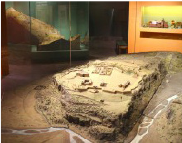
Plan-relief de Mont-Dauphin

et la ligne de crête des Alpes et des Pyrénées devant constituer les 'bornes' de la France ; pour lui Genève, la Savoie et le comté de Nice sont un « pré carré d'une convenance très utile à cause de la Province du Dauphiné ». Mais arrive Bonaparte qui franchit les Alpes, crée la République cisalpine,