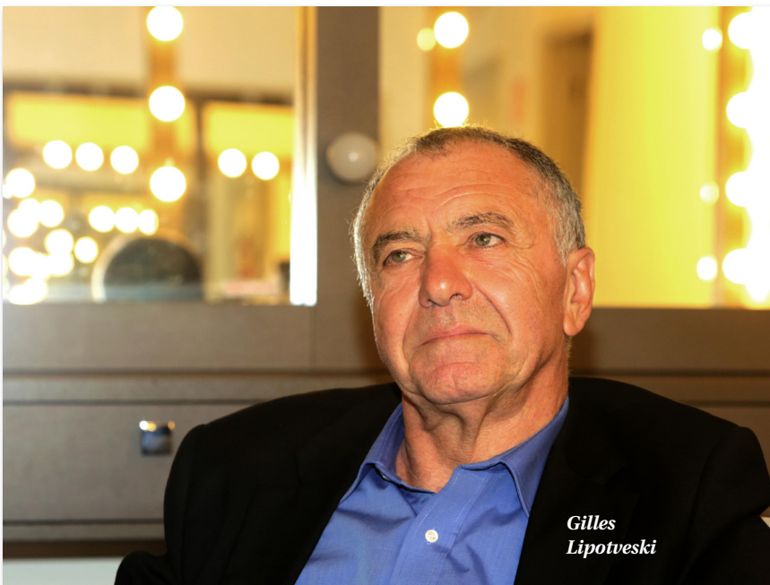
Fronteiras do Pensamento / Greg Seiblian