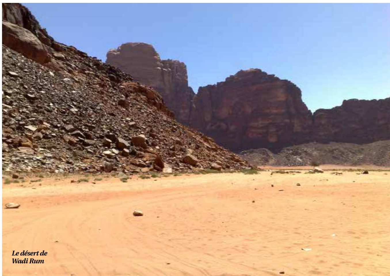
Le désert de Wadi Rum